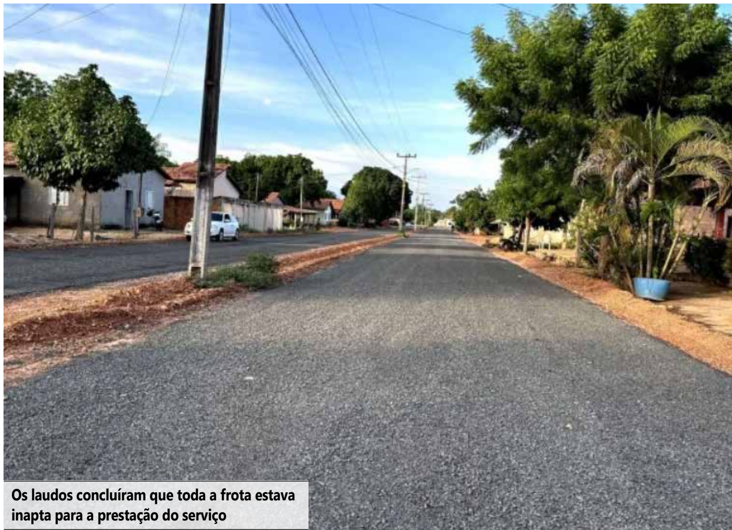
Os laudos concluíram que toda a frota estava inapta para a prestação do serviço

Na decisão, os conselheiros destacaram que o