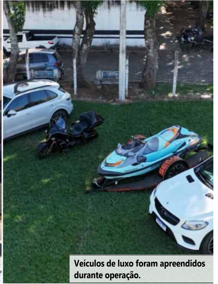
Veículos de luxo foram apreendidos durante operação.

ele estava em posse de uma pistola calibre .380 e foi autuado em flagrante por posse irregular de arma de fogo de uso permitido.