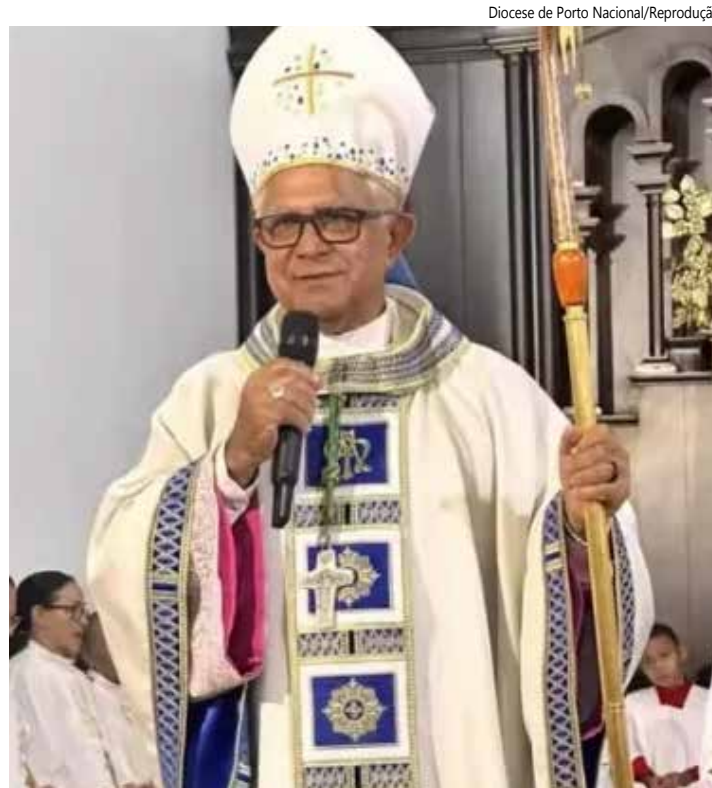
Dom José Moreira da Silva, bispo de Porto Nacional.

A Diocese de Porto Nacional é uma das mais tradicionais do Tocantins e atende dezenas de paróquias distribuídas por municípios da região central e sul do estado. Até o momento, a Igreja Católica não divulgou informações sobre os motivos da renúncia. Com a vacância do cargo, caberá ao Vaticano definir, nos próximos meses, o nome do novo bispo que assumirá a condução da Diocese de Porto Nacional. A nomeação de Dom Pedro Brito como administrador apostólico garante a continuidade das atividades pastorais, administrativas e religiosas da diocese durante o período de transição.