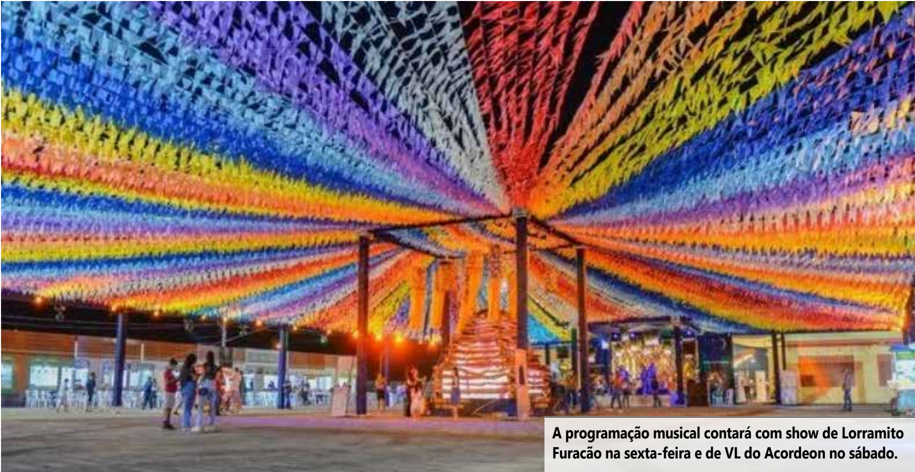
A programação musical contará com show de Lorramico Furacão na sexta-feira e de VL do Acordeon no sábado.

Além das atrações culturais, o Arraiá da Serra terá barracas com a venda de comidas típicas juninas,