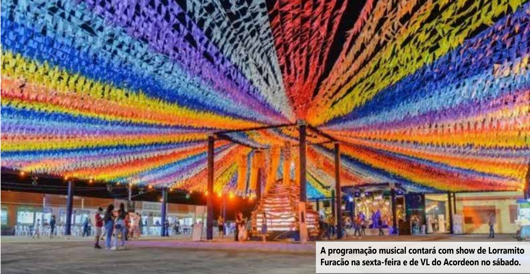
A programação musical contará com show de Lorramico Furacão na sexta-feira e de VL do Acordeon no sábado.

Além das atrações culturais, o Arraiá da Serra terá barracas com a venda de comidas típicas juninas,