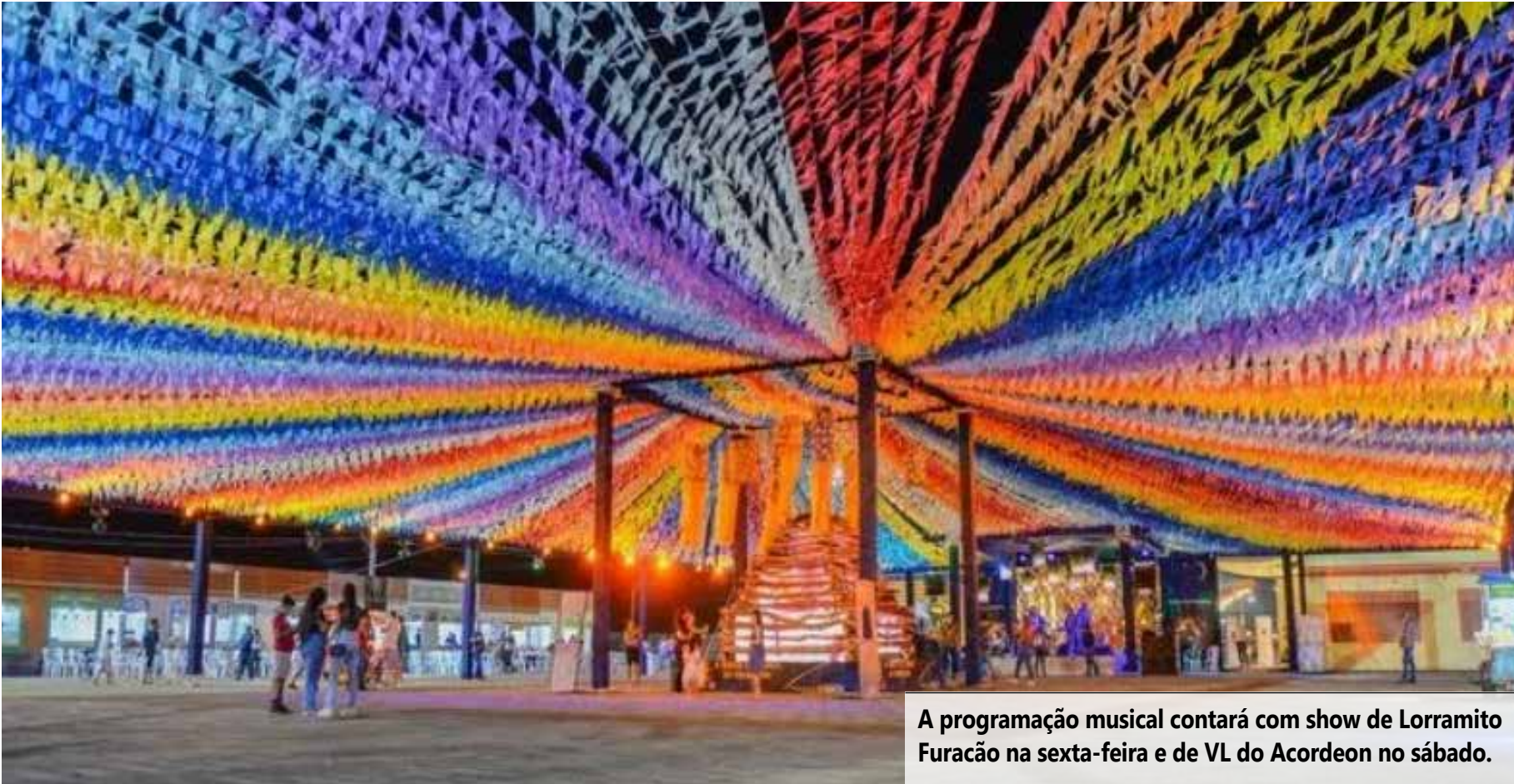
A programação musical contará com show de Lorramico Furacão na sexta-feira e de VL do Acordeon no sábado.

Além das atrações culturais, o Arraiá da Serra terá barracas com a venda de comidas típicas juninas,