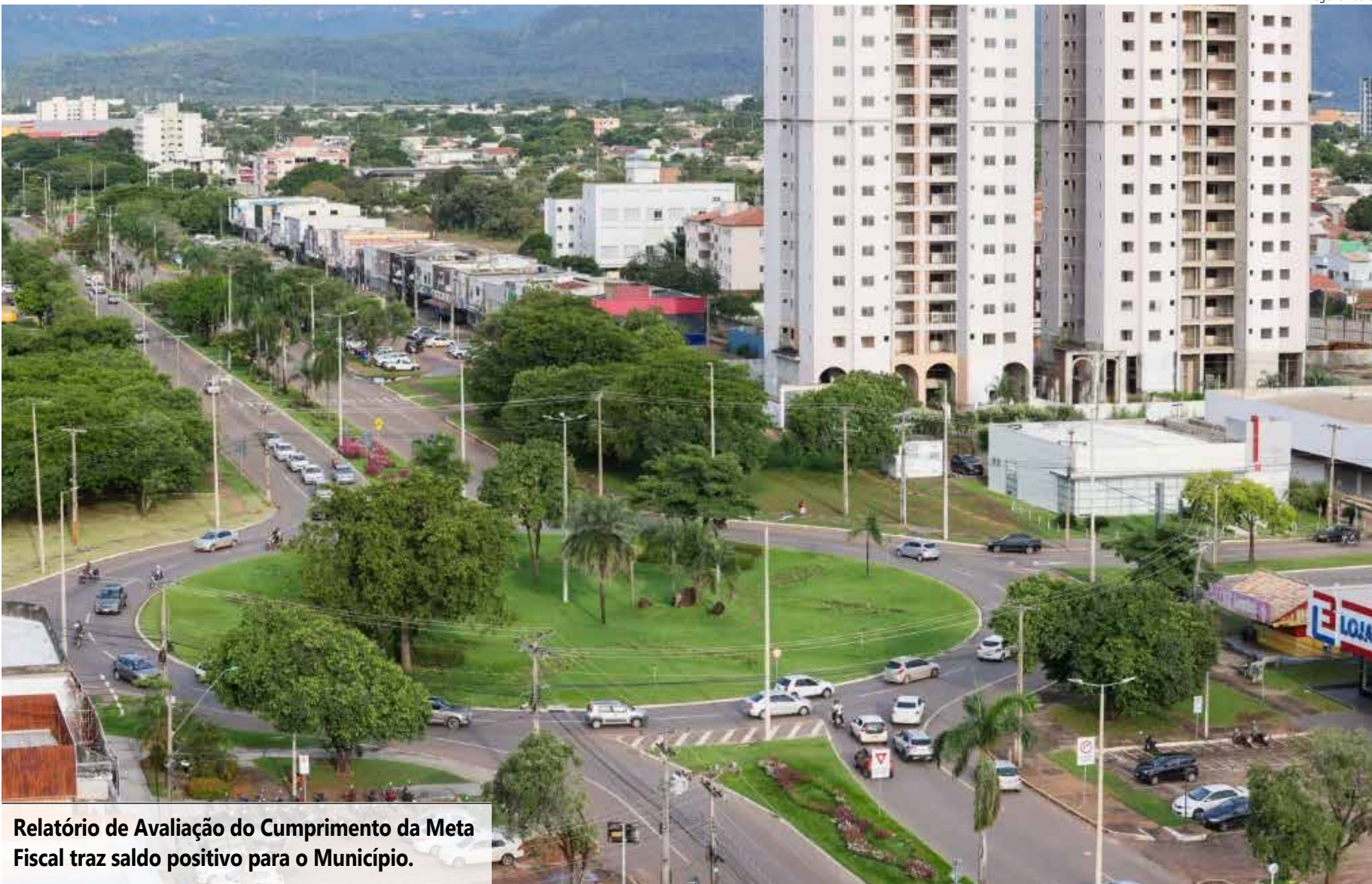
Relatório de Avaliação do Cumprimento da Meta Fiscal traz saldo positivo para o Município.

Pelas regras aprovadas, a parcela que caberá a cada município será calculada com base na média da arrecadação do ISS e da cota-parte do ICMS entre 2019 e 2026. O índice servirá como referência para a distribuição dos recursos por um período de até 50 anos.