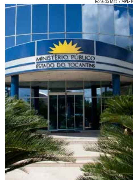
Ministério Público do Tocantins - MPE-TO.