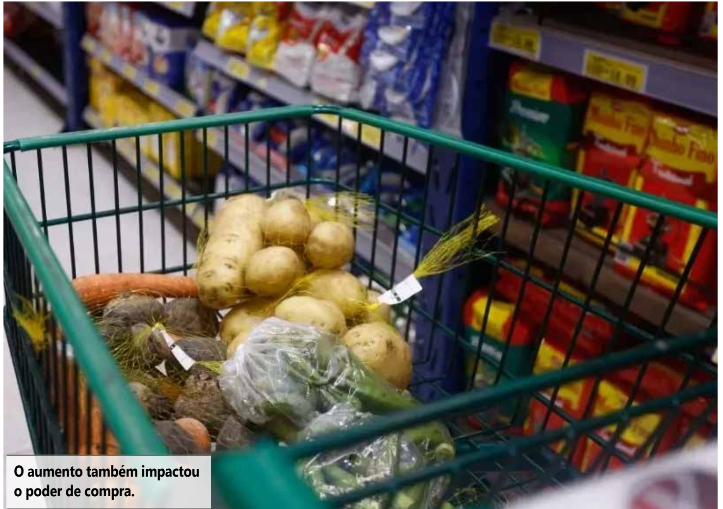
O aumento também impactou o poder de compra.

Por outro lado, alguns itens apresentaram queda, como o açúcar (-6,9%), o óleo de soja (-2,5%), o café (-2%) e a farinha de mandioca (-1,3%), mas