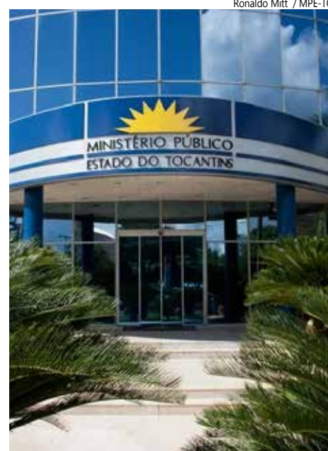
Ministério Público do Tocantins - MPE-TO.