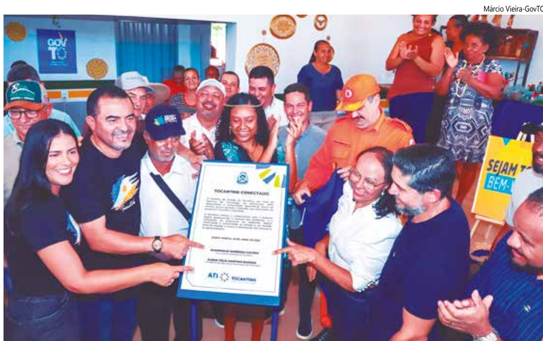
Governador Wanderlei Barbosa-projeto Tocantins Conectado.

Na comunidade, a nova conexão já começa a impactar o cotidiano