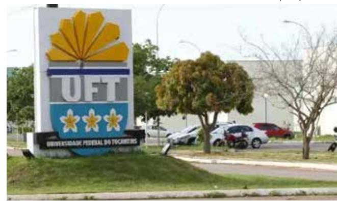
Universidade Federal do Tocantins em Palmas.