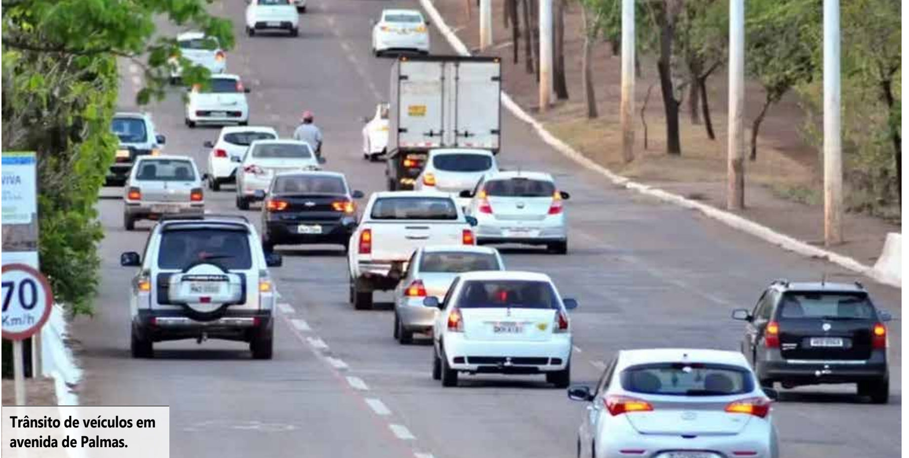
Tráfego de veículos em avenida de Palmas.

Para motoristas das categorias C, D e E, é obrigatório estar com os exames em dia.