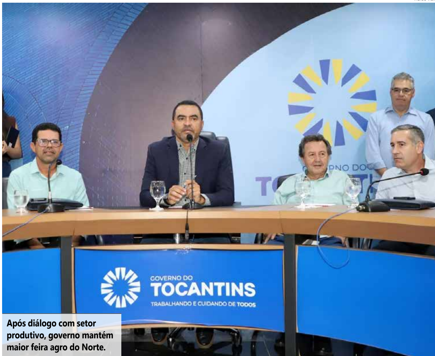
Após diálogo com setor produtivo, governo mantém maior feira agro do Norte.

O evento reúne produtores, empresas, instituições de pesquisa e o público em geral, com foco na difusão de tecnologias, fortalecimento do agronegócio e geração de negócios.