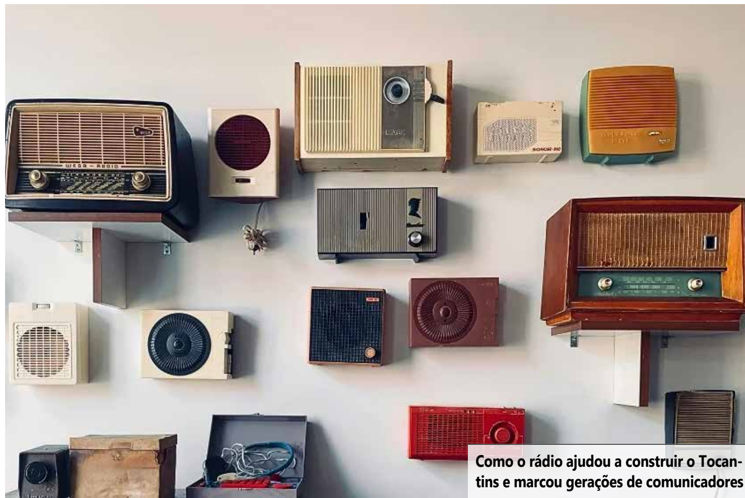
Como o rádio ajudou a construir o Tocantins e marcou gerações de comunicadores

Apesar das limitações, o rádio se consolidou como