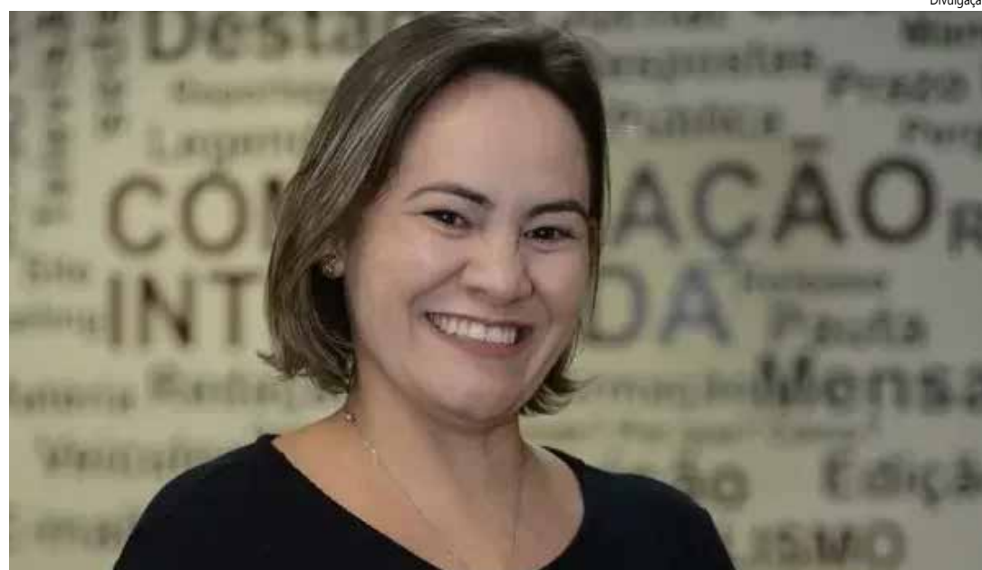
Ela assume a função após a saída de Elcio Mendes, que deixou o comando da pasta a pedido

Natural de Pernambuco, Déborah é formada em