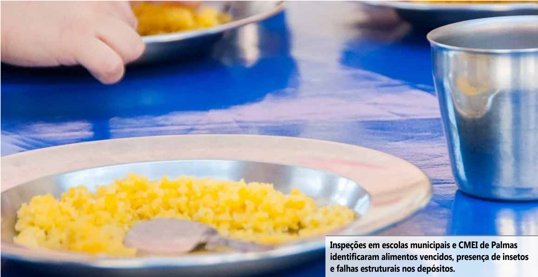
Inspeções em escolas municipais e CMEI de Palmas identificaram alimentos vencidos, presença de insetos e falhas estruturais nos depósitos.

O MP RECOMENDOU À SECRETARIA MUNICIPAL DE EDUCAÇÃO (SEMED) DE PALMAS A REGULARIZAÇÃO IMEDIATA DA MERENDA ESCOLAR EM TRÊS UNIDADES DA CAPITAL.