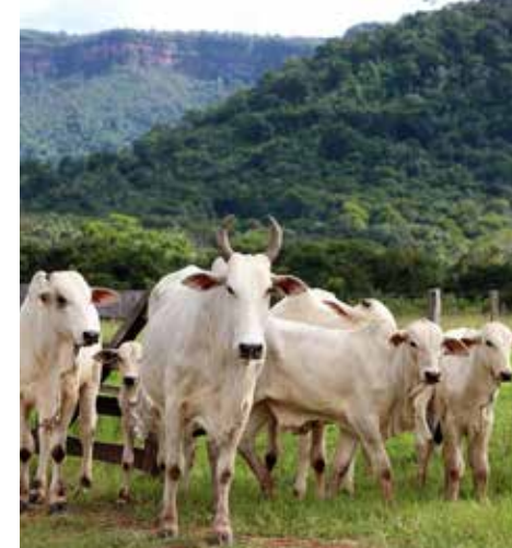
Rastreabilidade Bovina no Tocantins