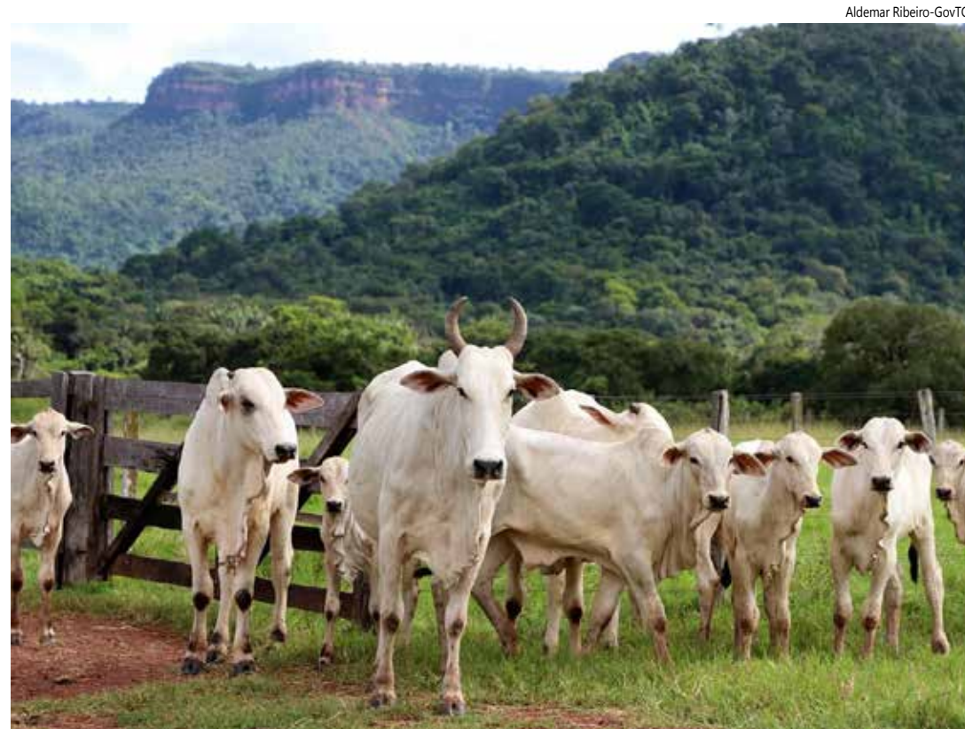
Rastreabilidade Bovina no Tocantins

De acordo com a Agência de Defesa Agropecuária do Tocantins, o novo mo-