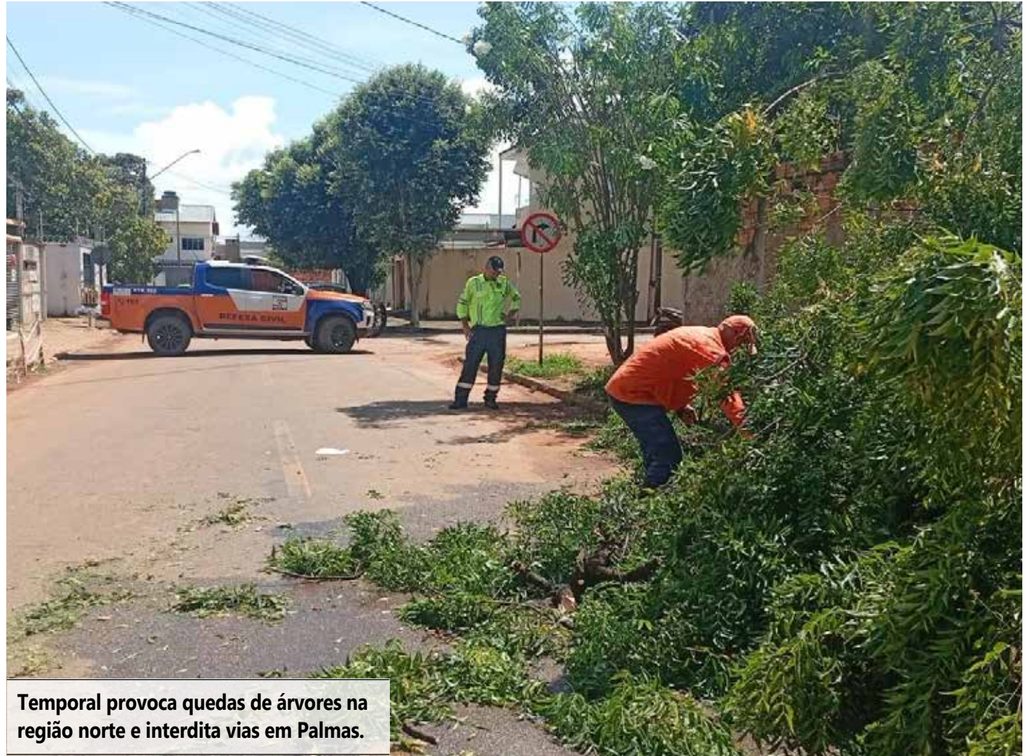
Temporal provoca quedas de árvores na região norte e interdita vias em Palmas.

“Durante tempestades, a orientação é evitar circular