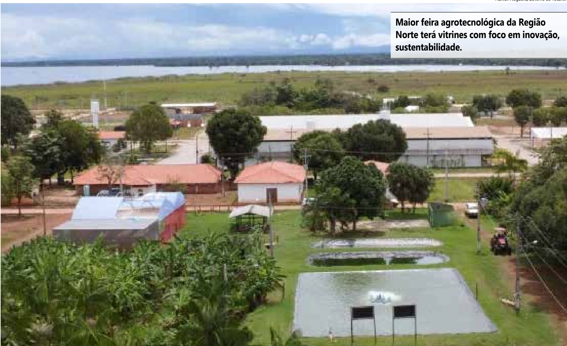
Maior feira agrotecnológica da Região Norte terá vitrines com foco em inovação, sustentabilidade.