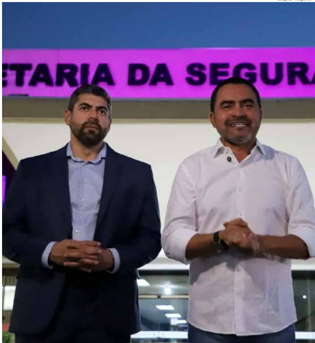
Certame prevê cargos de delegado, oficial investigador e perito.