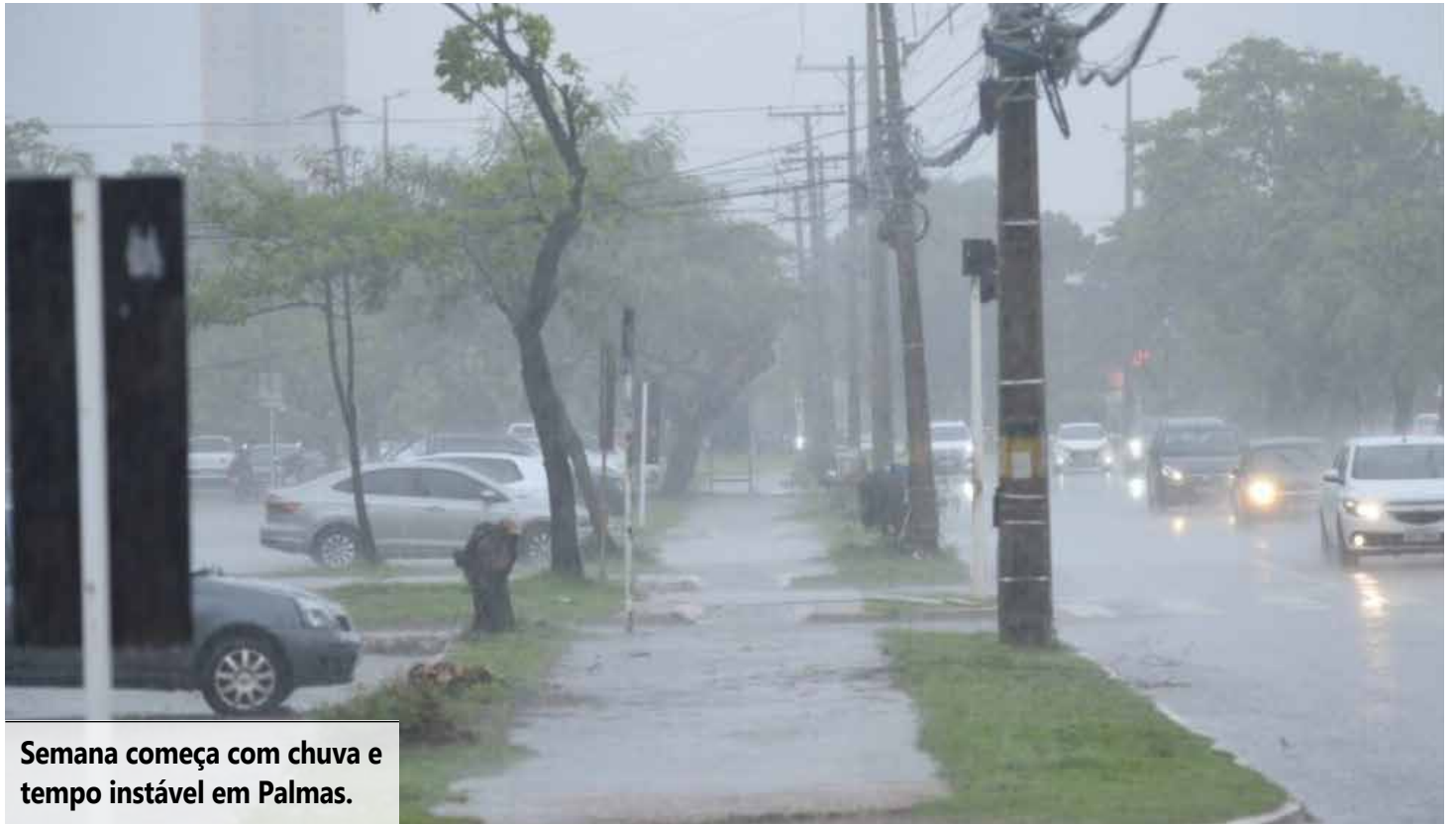
Semana começa com chuva e tempo instável em Palmas.

Na sexta-feira (3), o céu deve permanecer encoberto, com ocorrência de chuva isolada ao longo do dia. As temperaturas seguem estáveis, com mínima de 23°C e máxima de 30°C.