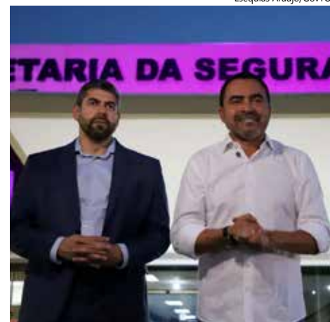
Certame prevê cargos de delegado, oficial investigador e perito.