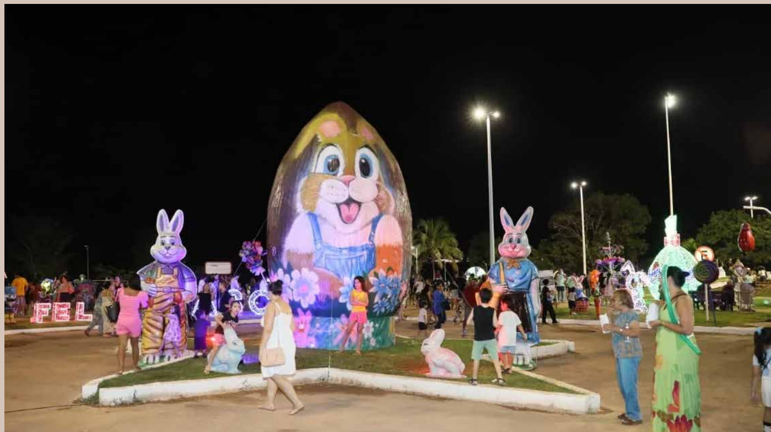
Programação segue até domingo, 5, no Parque Cesamar.