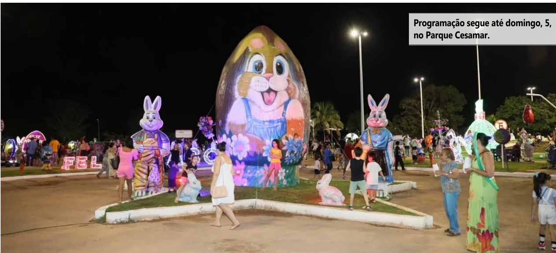
Programação segue até domingo, 5, no Parque Cesamar.

Quarta-feira (1º) 19h – Os Cavalim e Bonecos de Taquaruçu 20h – Kikintura 21h – Orquestra Jovem