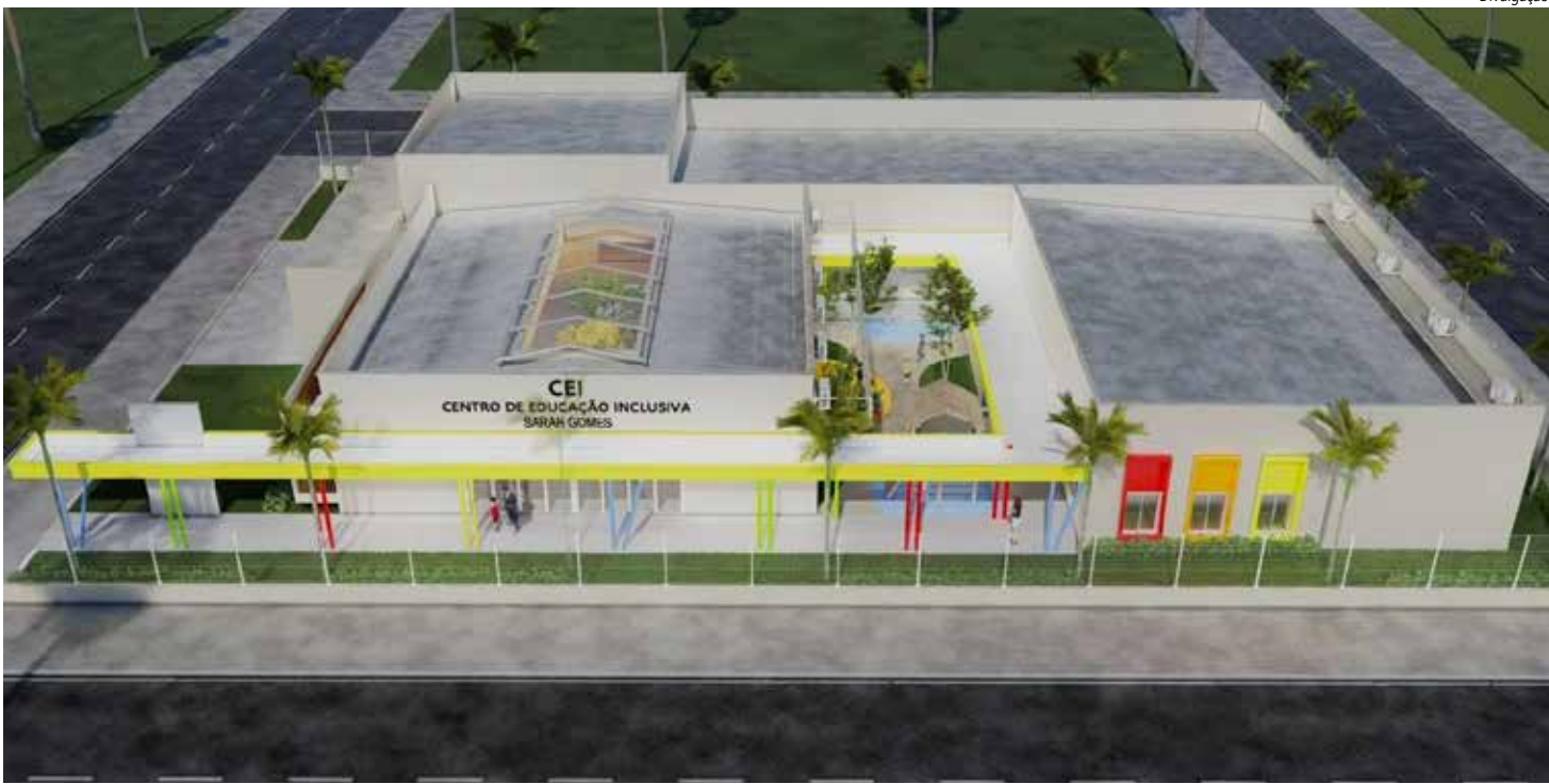
Obra será executada com tecnologia modular em painéis isotérmicos.