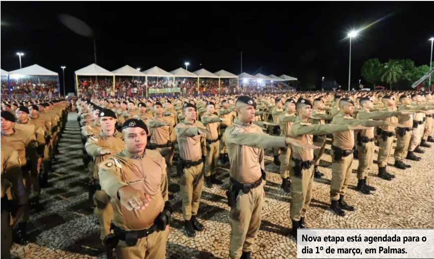
Nova etapa está agendada para o dia 1º de março, em Palmas.

POSICIONAMENTO DA PMTO Ao comentar a decisão, o comandante-geral da Polícia Militar do Tocantins destacou o compromisso da corporação com a transparência do concurso. Segundo o comando da instituição, a prioridade é garantir justiça e credibili-