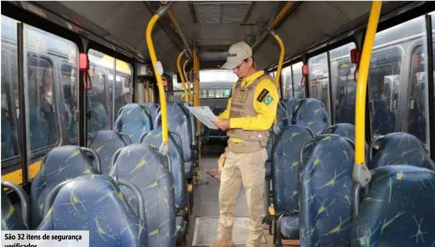
São 32 itens de segurança verificados.

a infração também é gravíssima, com multa de R$ 293,47, sete pontos na CNH e retenção do veículo até a apresentação de condutor habilitado. O órgão alerta ainda que a circulação irregular de veículos escolares pode resultar em responsabilização administrativa. Denúncias podem ser feitas ao Detran/TO, à Polícia Militar, à Polícia Rodoviária Federal e às secretarias de Educação.