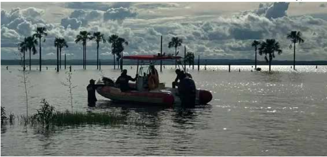
Corpo de homem é encontrado após buscas subaquáticas na Praia dos Buritis.

Segundo os bombeiros, a vítima aparentava ter aproximadamente 55 anos, mas não havia identifica-