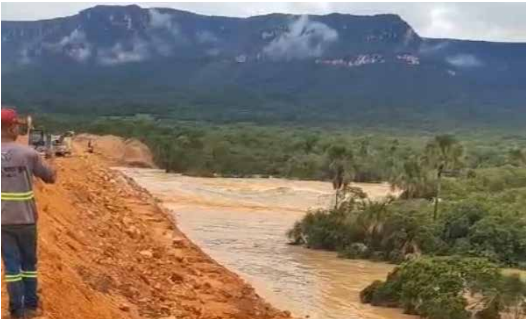
A Polícia Civil do estado instaurou inquérito para apurar as circunstâncias.

Uma barragem de uma pequena central hidrelétrica (PCH) sofreu rompimento na manhã desta sexta-feira (19) em Ponte Alta do Bom Jesus, no sudeste do Tocantins. A Polícia Civil do estado instaurou inquérito para apurar as circunstâncias do ocorrido, investigando possíveis crimes ambientais e situações de risco à coletividade. Segundo informações preliminares do Corpo de Bombeiros, acionado às 8h50, a falha atingiu cerca de dois metros da parte superior da barragem (crista) durante o fechamento do vertedouro, dispositivo que controla o nível da água. As causas e a extensão total dos danos ainda estão sendo apuradas. A 103ª Delegacia de Polícia é a responsável pelo procedimento investigativo. A Polícia Civil informou que diligências iniciais já foram determinadas, in-