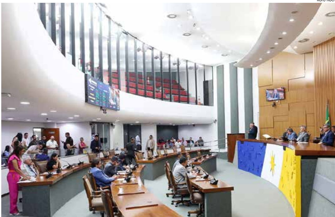
Aleto aprovou dois projetos de lei de conversão, de autoria do Governo do Estado.

As matérias tramitaram com a denominação de Projeto de Lei de Conversão porque é o nome dado ao Projeto de Lei (PL) que surge a partir da aprovação de Medida Provisória (MP). Depois será submetido à sanção do governador do Estado.