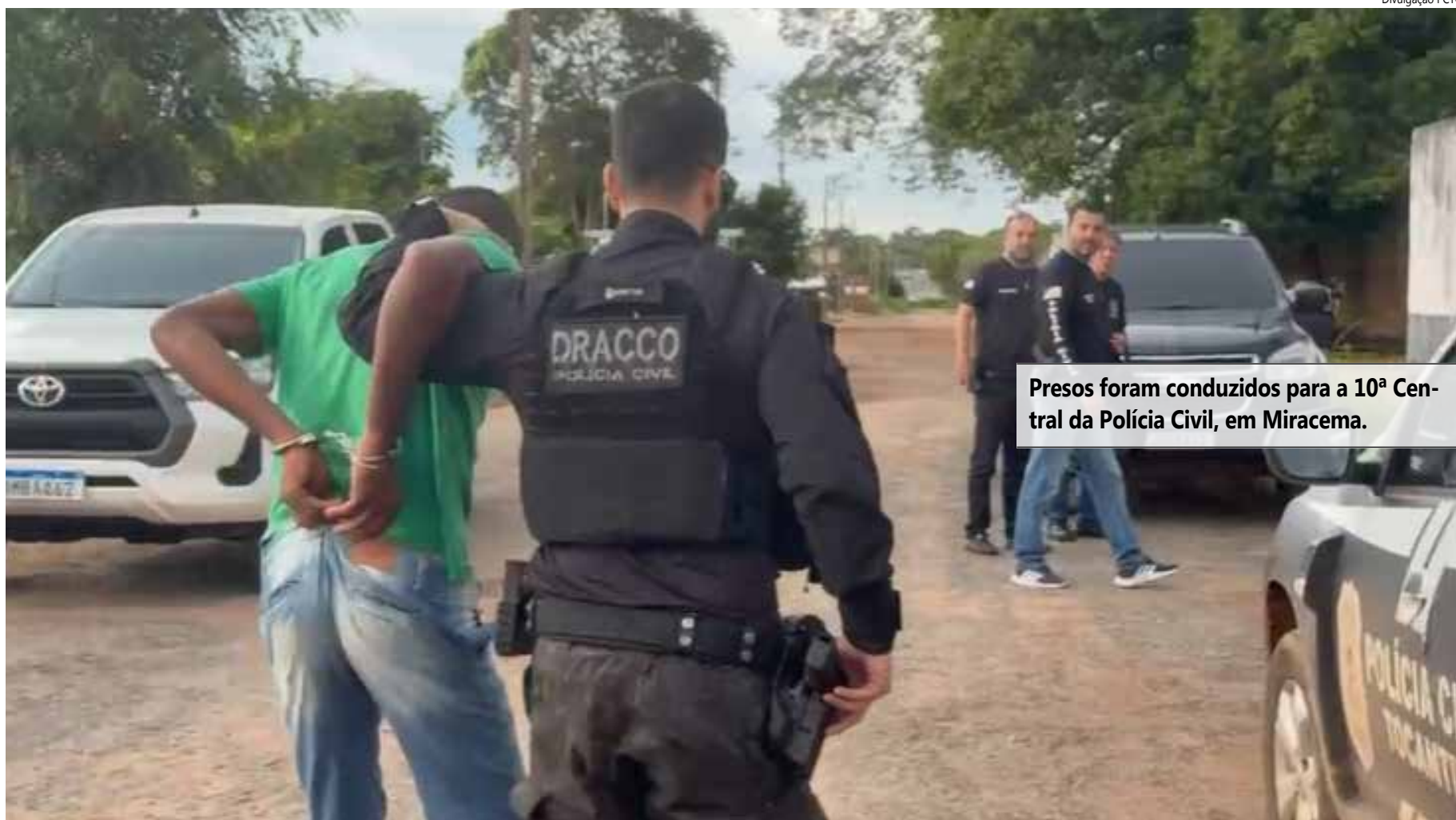
Presos foram conduzidos para a 10ª Central da Polícia Civil, em Miracema.

Tocantins e Guaraí, da Divisão Especializada de Repressão à Corrupção (DECOR) de Paraíso do Tocantins, da 66ª Delegacia de Miranorte, das 67ª e 68ª Delegacias de Miracema e do Grupo de Operações Táticas Especiais (GOTE). (Informações: Secretaria de Segurança Pública)