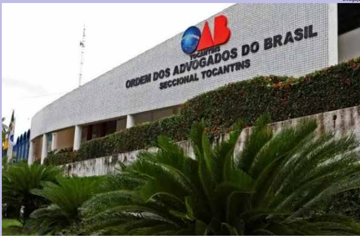
De acordo com o presidente da OABTO a anuidade da OABTO é a menor e melhor do Brasil.

Pelo quinto ano consecutivo, a OAB Tocantins mantém a anuidade mais barata do Brasil, com o valor de R$ 671,00. Este valor é uma das maiores vantagens oferecidas aos advogados e advogadas tocan- tinenses, que continuam a ser beneficiados por uma gestão comprometida com a eficiência e com a valo- rização da classe. A infor- mação foi destaque no site Migalhas, especializado em temas jurídicos. De acordo com a matéria, em compa- ração com outras seccionais, a OABTO se mantém com a anuidade mais aces- sível entre as 27 seccionais do país.