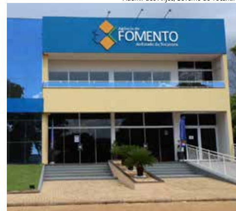
Fachada da nova sede da Agência de Fomento - 802 Sul.