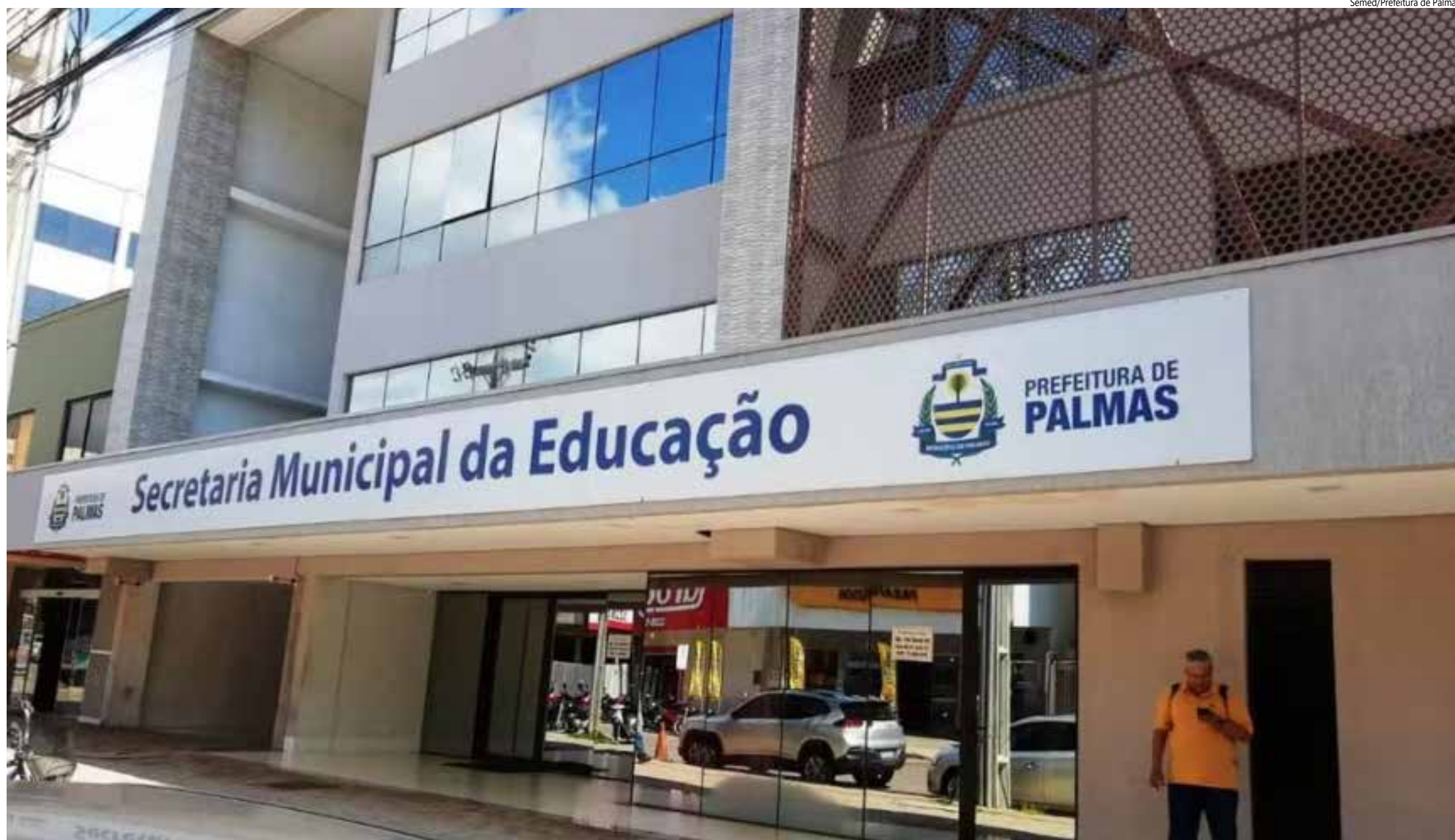
Semed/Prefeitura de Palmas