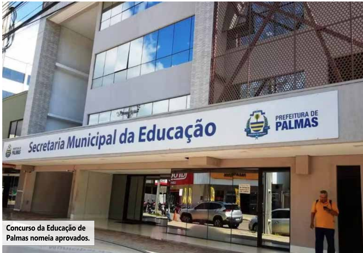
Concurso da Educação de Palmas nomeia aprovados.

O Estatuto dos Servidores Públicos da Administração Direta e Indireta dos Poderes do Município de Palmas estabelece que a posse ocorrerá no prazo de 30 dias, contados da publicação do ato de nomeação, podendo