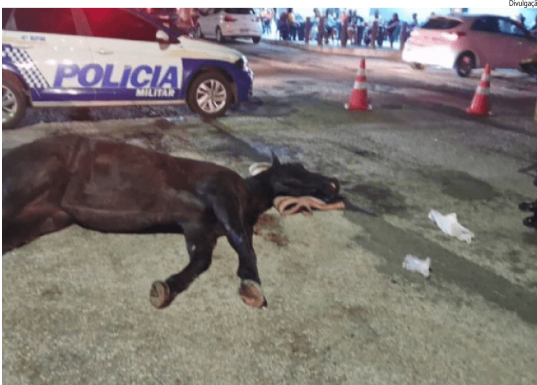
Egua morre durante cavalgada na 49ª Exposição Agropecuária de Gurupi.

Ao Delegado Regional da Polícia Civil e à Polícia Militar foram solicitadas informações sobre registros de Boletim de Ocorrência