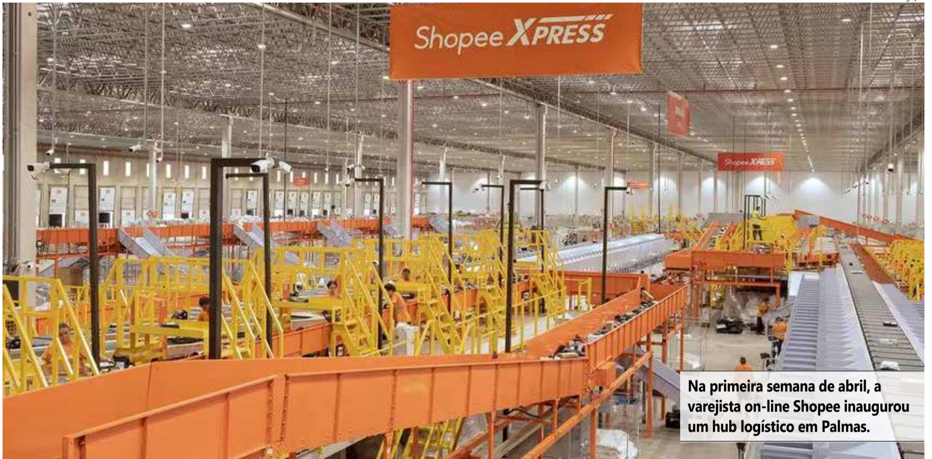
Na primeira semana de abril, a varejista on-line Shopee inaugurou um hub logístico em Palmas.

A Shopee, no entanto, não é a única grande empresa a encontrar no Tocantins o destino para expandir seus negócios. Somente em abril, foram anunciadas a implantação de uma fábrica de colchões da Gazin, em Araguatins; e a ampliação da estrutura de abate do frigorífico da Masterboi,